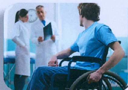
Организации социального обслуживания